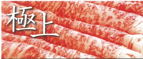
極上 しゃぶしゃぶ用 黒毛和牛ともみじ豚